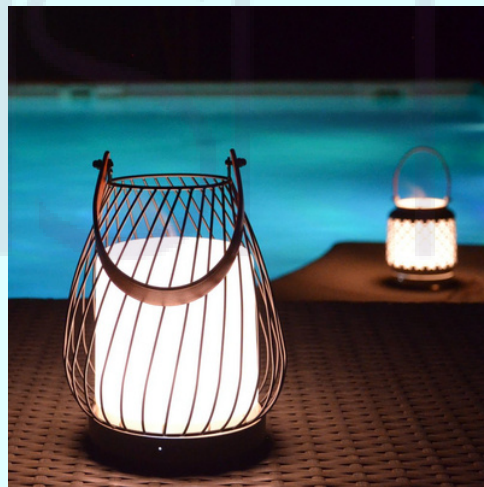
Nomadische Diffuser Lantaarn MILANO

2 dr. TerraShield 2 dr. Cedarwood 2 dr. Vetiver